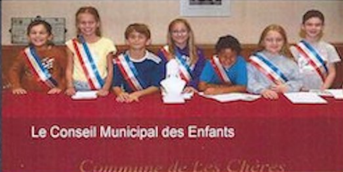
Le Conseil Municipal des Enfants